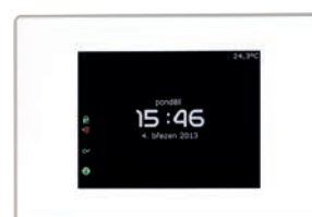
0201503455 MP5-M-WHITE ovládací panel s dotykovým displejem 5,7", zápusťná montáž, čelní deska - hliník 136 × 200 × 8 mm, bílá