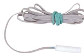
0201507205 TS1-MP5 teplotní sonda pro MP5