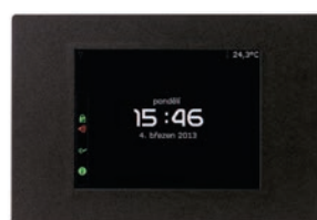
0201503450 MP5-M-BLACK ovládací panel s dotykovým displejem 5,7", zápusťná montáž, čelní deska - hliník 136 × 200 × 8 mm, černá